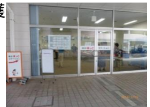
東部ほっとステーション (サンマルシェ南館1階)

私共は、今年度も地域ふれあい事業として住民主体の交流の場を東部ほっとステーションと法人本部(岩成台)で、提供していきたいと