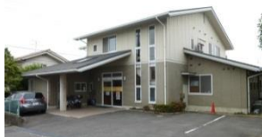
法人本部(岩成台10丁目)

私共は、今年度も地域ふれあい事業として住民主体の交流の場を東部ほっとステーションと法人本部(岩成台)で、提供していきたいと