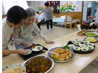
敬老の日はバイキング昼食でした。