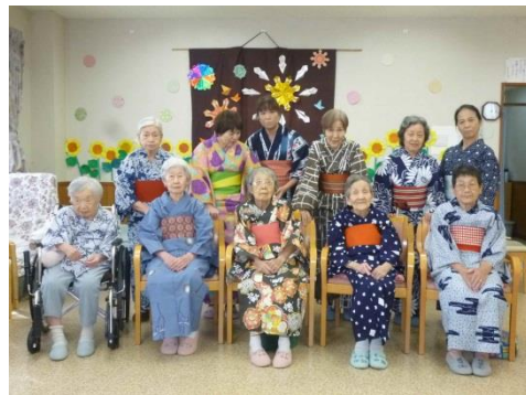
浴衣を着て盆踊り大会です。